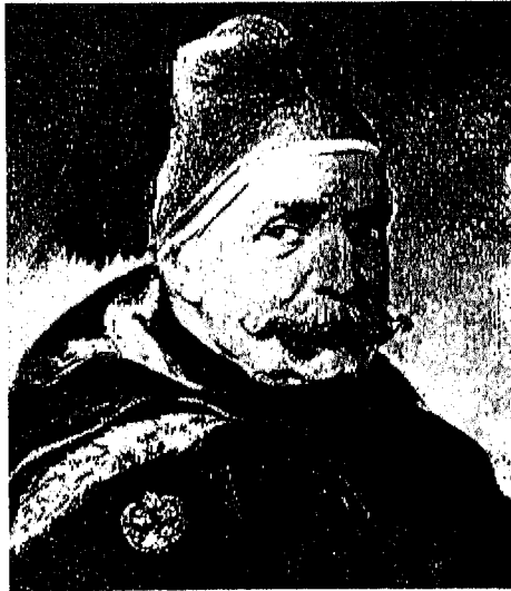
الجنرال سليمان الفرنساوى . . أبو العسكرية المصرية الحديثة ، والجد الأكبر للملكة نازلي،